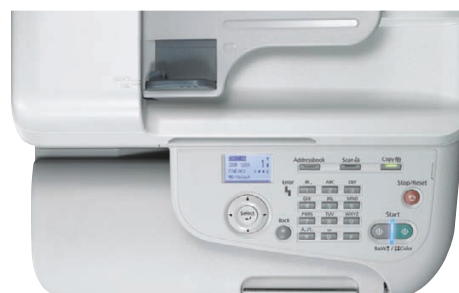
Les commandes claires et accessibles facilitent considérablement l'utilisation de la série AcuLaser CX37DN