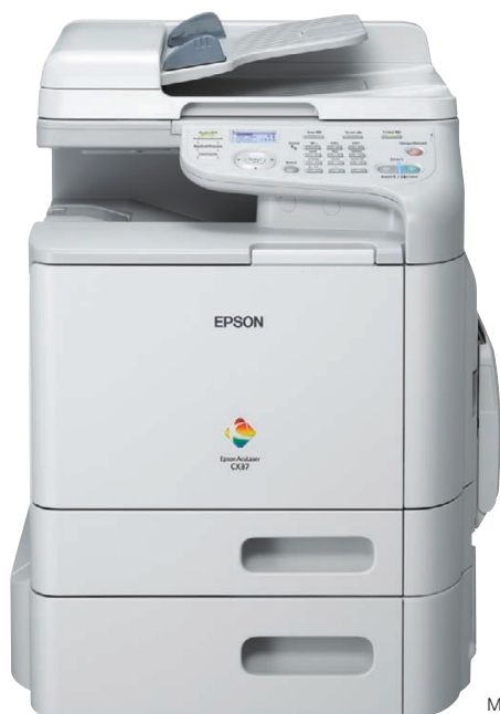
Modèle présenté : AL-CX37DTNF

La série Epson AcuLaser CX37DN permet aux moyens et grands groupes de travail d'imprimer en A4 Recto Verso, de copier et de numériser en couleur et en monochrome. La fonction fax est disponible sur les modèles AcuLaser CX37DNF et CX37DTNF. Cette série est équipée en standard d'un scanner avec chargeur automatique de documents, et dispose d'un bac papier optionnel qui permet aux groupes de travail d'améliorer leur productivité, leur confort d'utilisation, et de gagner du temps en augmentant la capacité papier.