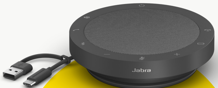
MODÈLES MS TEAMS ET UC

Dans une perspective de développement durable, nous veillons à réduire notre empreinte écologique à chaque étape de la fabrication de nos produits. Le revêtement du Speak2 55 est composé de plus de 50 % de matériaux durables** et d'un nombre important de pièces réparables ou remplaçables. Voilà l'équation magique : préservation de l'environnement = durée de vie prolongée = qualité d'appels supérieure sur la durée, pour vous et votre équipe.