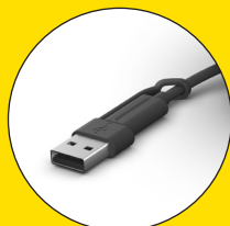
Connecteurs USB-C et USB-A fournis